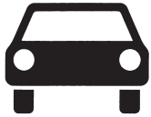
Kraftwagen und sonstige mehrspurige Kraftfahrzeuge