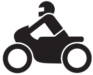
Krafträder, auch mit Beiwagen, Kleinkrafträder und Mofas